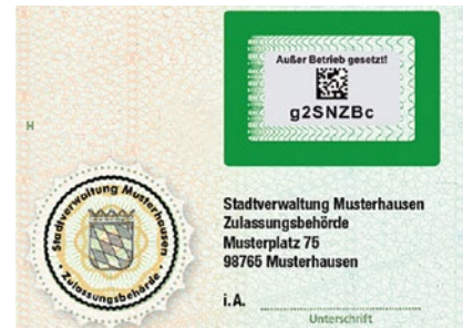
Abb. 1/2: Freirubbeln des Sicherheitscodes