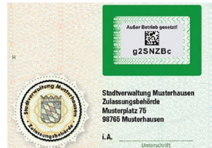
Abb. 1/2: Freirubbeln des Sicherheitscodes