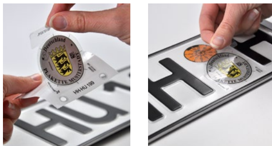
Abb. 7/8: Siegelplakette abziehen und positionieren