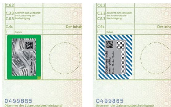
Abb. 5/6: Sicherheitscode auf der Zulassungsbescheinigung Teil II